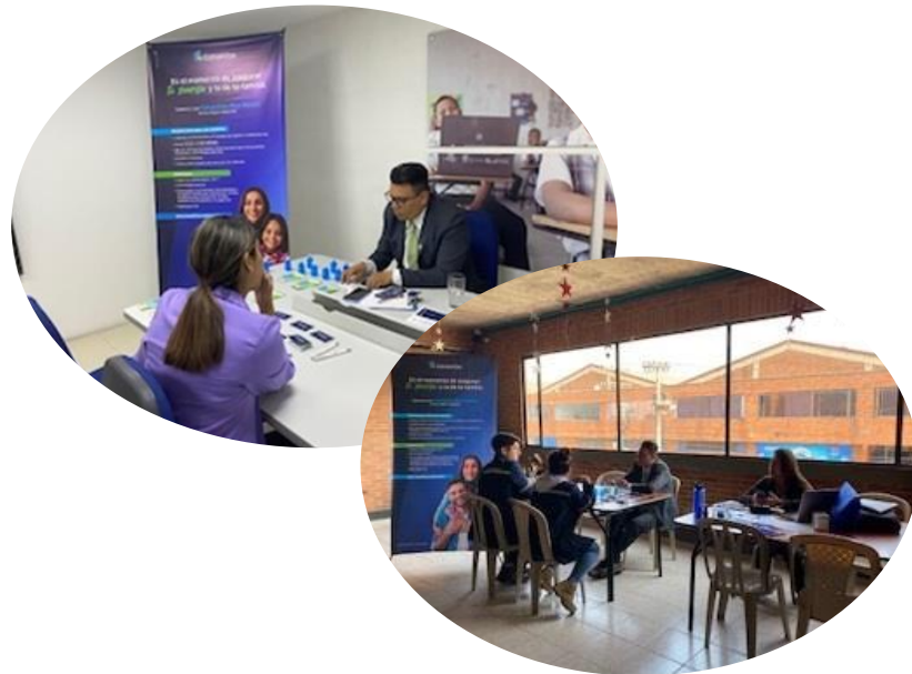
Feria de promoción y prevención en salud