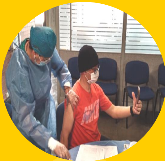
Jornada de vacunación